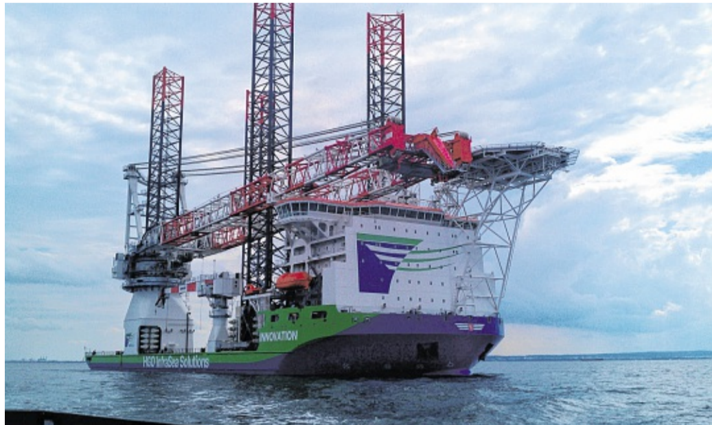
Ist bereits mit der innovativen Kühlertechnologie der Stäbelower Firma Heat Nord ausgerüstet: das Offshore-Errichterschiff „Innovation“ der Reederei DEME.

Konventionelle Seekastenkühler werden im Schiffsrumpf unterhalb der Wasserlinie eingebaut und dienen dazu, mit durchströmendem Meerwasser den Kühlwasserkreislauf der Schiffsmotoren auf einer optimalen Temperatur zu halten und Wärme abzuführen. Das Problem bei diesem System ist, dass die